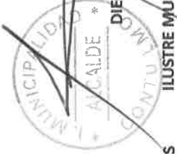
DIEGO IBAÑEZ BURGOS ALCALDE ILUSTRE MUNICIPALIDAD DE CONTULMO