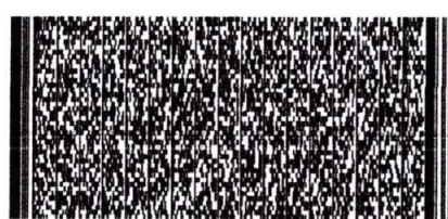
Timbre Electrónico SII

Res.99 de 2014 Verifique documento: www.sii.cl