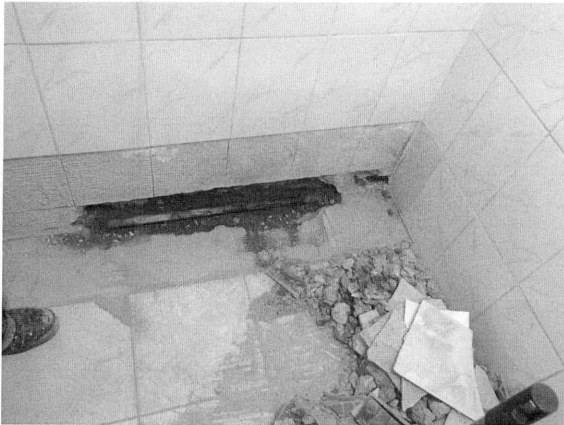
Imagen 3.- Cañería de red de agua potable rota con pérdida de agua.

Por la necesidad urgente de reparación y considerando que la empresa Alfasur Construcción y Servicios se encontraba cuantificando los trabajos requeridos para reparar la fuga del jardín Continente Blanco, se les solicito se presentaran en el jardín Villa Austral para apoyar en la búsqueda de la fuga y la posterior cotización de la reparación de forma inmediata, se adjunta cotización.