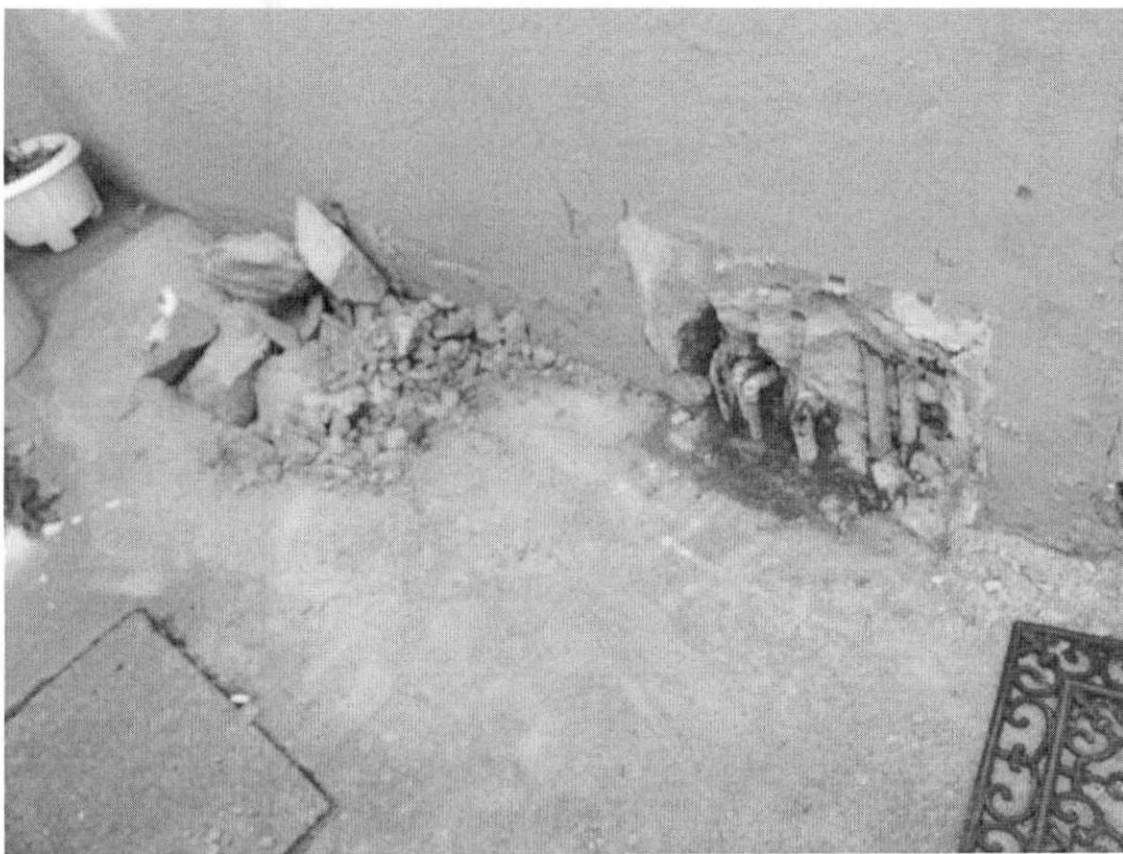
Imagen 2. Se observa cañerías de red de calefacción fuera de servicio colapsadas y con pérdida de agua.

A primera hora de ayer lunes 02.05.17. desde el jardín infantil Villa Austral se nos informa que al abrir el jardín infantil a primera hora de la mañana se observó una mancha de agua desde el sector de patio de servicios, además de una baja en la presión del agua, al visitar el jardín se pudo verificar que se observa una mancha de agua en el piso por el interior y exterior del jardín, al picar se observa que la cañería de agua potable y otra de la red de calefacción fuera de servicios a colapsado rompiéndose y generando la fuga del agua, como se observa en las imágenes 2 y 3.