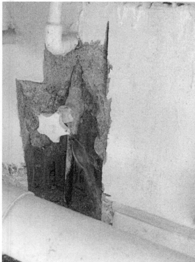
Imagen 1. Se observa cañería rota con pérdida de agua.

Con estos antecedentes, se revisa las instalaciones del jardín, donde en la SHHHH del nivel medio menor B constantemente el piso se acumulaba agua sin conocer la procedencia exacta. Finalmente se rompe el muro donde se encuentra la cañería rota, como se muestra en la imagen 1.