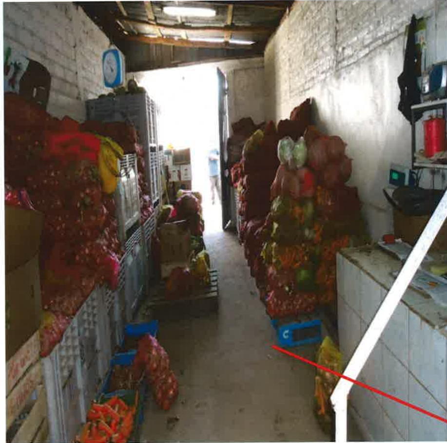
ALICOPSA, PROVINCIA DE LIMARÍ