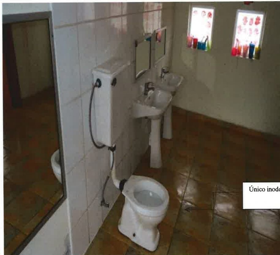
Jardín infantil Ternura