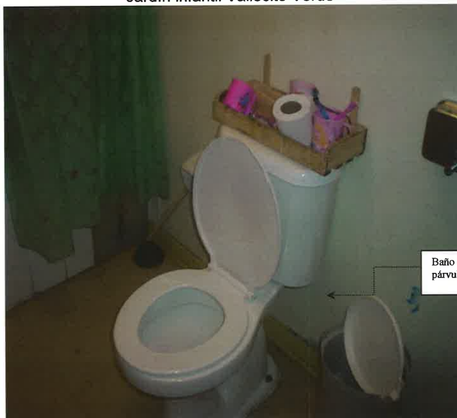
Jardín infantil Vallecito Verde