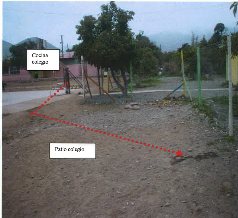
Jardín infantil Vallecito Verde