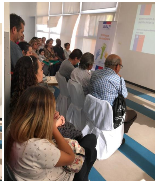
Presentación Directora Jardín Infantil