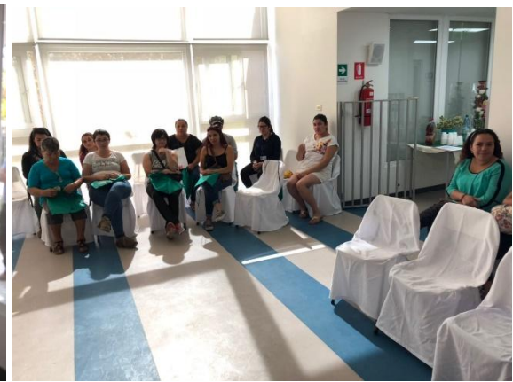
Llegada de los participantes