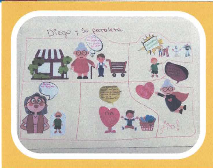
Diego y su pataleta