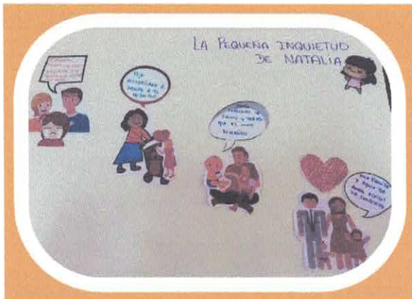
La pequeña inquietud de Natalia