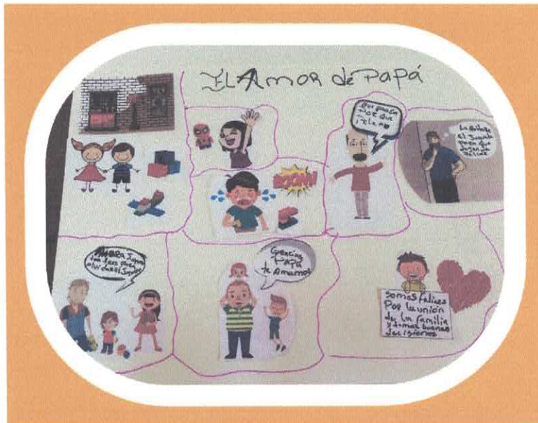
El amor de papá