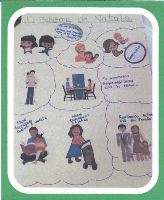
El problema de Natalia