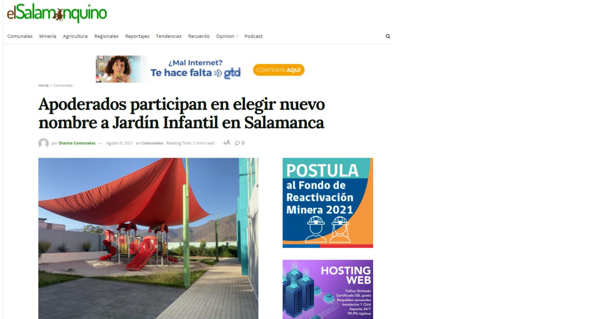
Apoderados participan en elegir nuevo nombre a Jardín Infantil en Salamanca – El Salamanquino