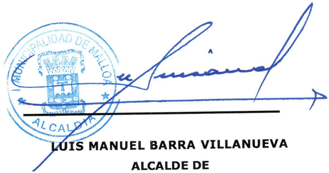
LUIS MANUEL BARRA VILLANUEVA ALCALDE DE ILUSTRE MUNICIPALIDAD DE MALLOA