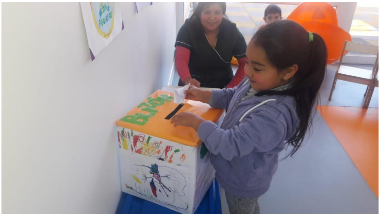
Niños y niñas son participes en las votaciones.