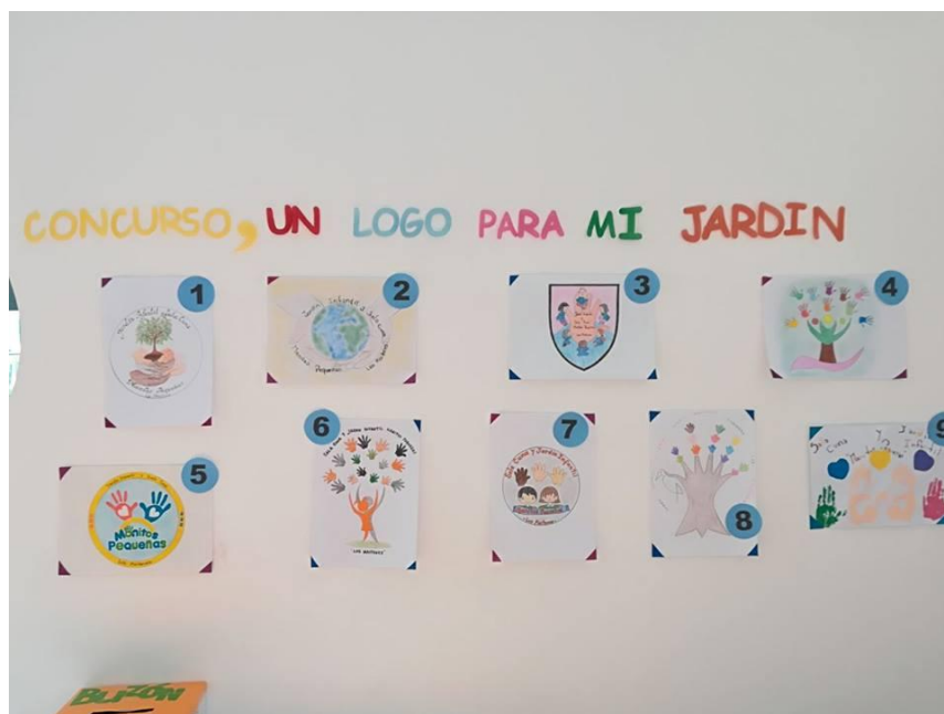
Propuestas a la iniciativa.