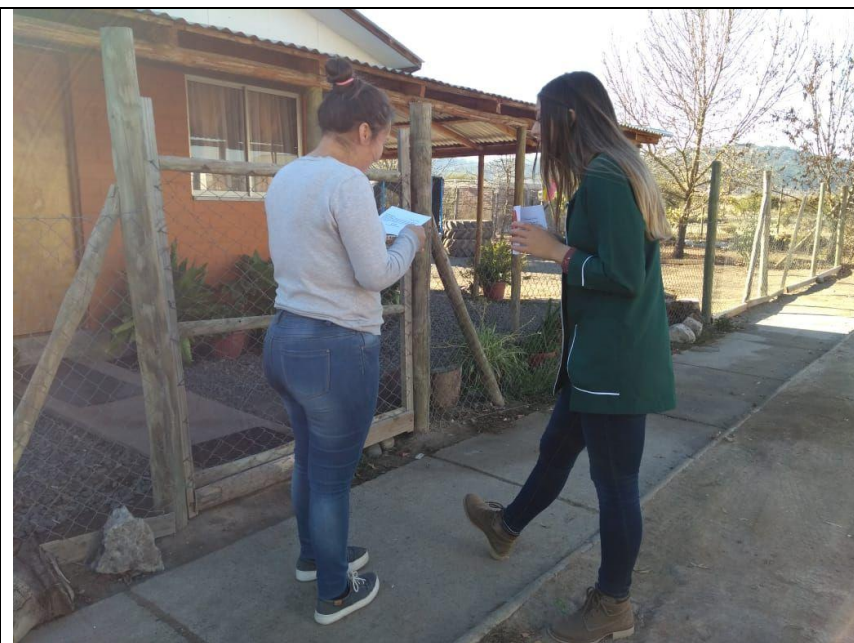
Puerta a puerta invitando a la comunidad.