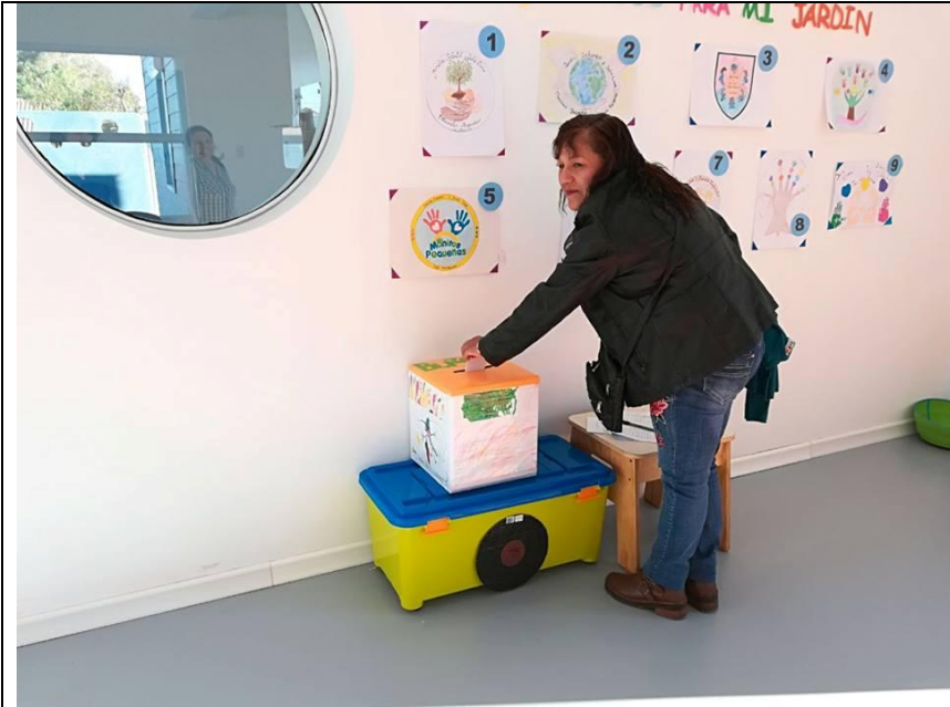
Representantes de la comunidad.