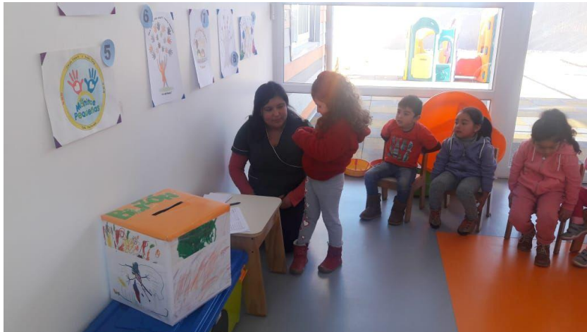
Niñas y niños participan en las votaciones.