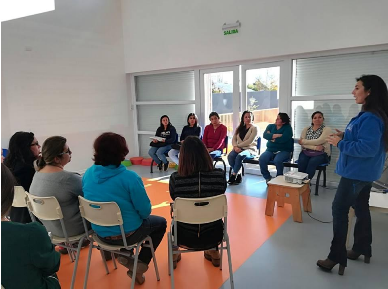
Apoderadas, vecinas e integrantes del equipo técnico participan del cierre de esta actividad.