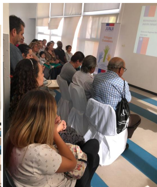
Presentación Directora Jardín Infantil