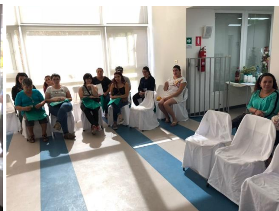
Llegada de los participantes