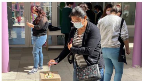
Comunidad educativa elige nuevo nombre a jardín infantil de Coquimbo