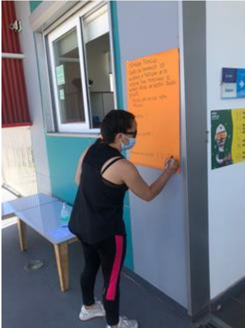
Árbol que recibió las propuestas: