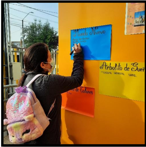
Imágenes diálogos finalización proceso consulta ciudadana