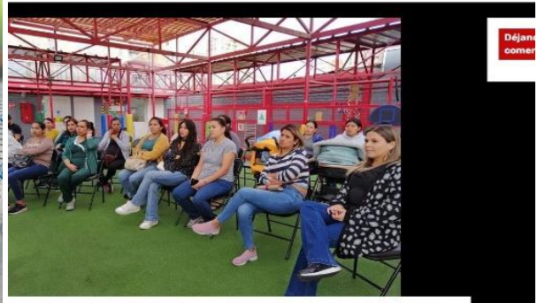
Un diálogo participativo destinado a abordar temáticas de familia fue el que organizó de manera